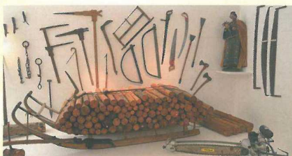
pracovní nástroje lesářů

K vidění je i třetí nejstarší lékárna Bavorského lesa. Také šňupacímu tabáku je věnováno vlastní oddělení. Mimořádné výstavy se navíc neustále starají o zvědavost návštěvníků.