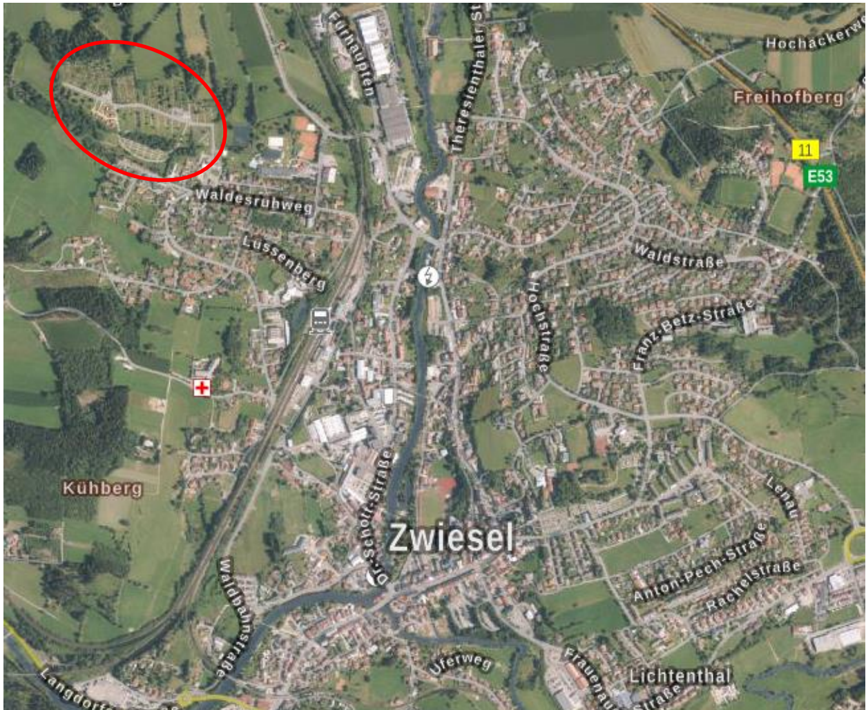
Abb. 2: Übersicht Planungsgebiet (Auszug Bayern-Atlas)

Der Arber-Ferienpark liegt am nordwestlichen Stadtrand von Zwiesel. Weitere für den Tourismus wichtige Sondergebiete grenzen unmittelbar an, wie z.B. die Familienferienstätte der Arbeiterwohlfahrt und das Zwieseler Erholungsbad. Die Tennisplatzanlagen des Tennisclub Zwiesel und das angrenzende Langlaufzentrum sind als Grünflächen ausgewiesen.