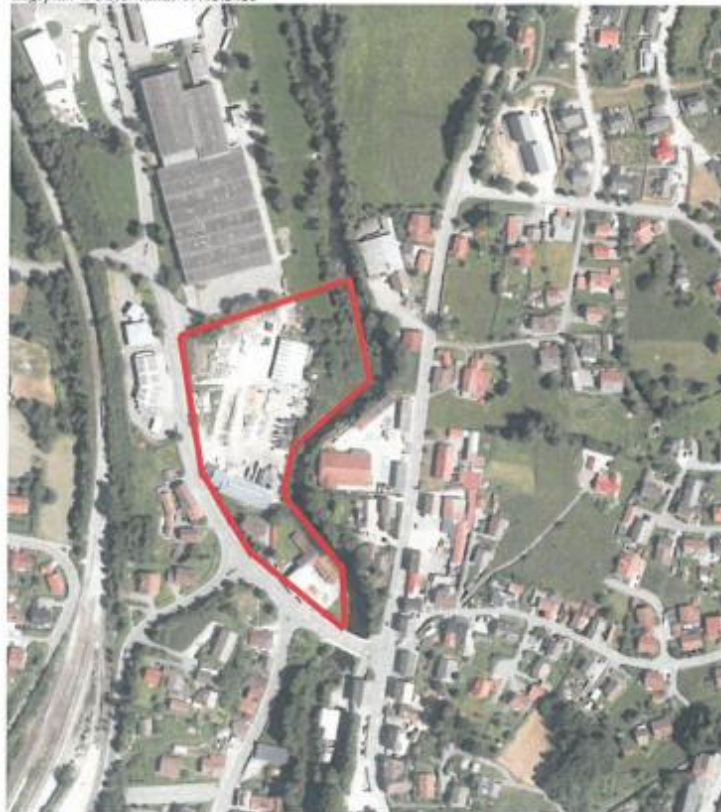
Lageplan 09.02.2023

Der Planbereich liegt überwiegend beim ehemaligen Sägewerk der Familie Lex, an der Rabensteiner Straße. Er ist im nachfolgend dargestellten Lageplan ersichtlich: