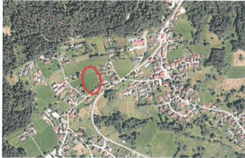
Lageplan

Der Geltungsbereich ist aus dem nachfolgenden Lageplan ersichtlich, der Bestandteil dieser Bekanntmachung ist. Der Bebauungsplan erstreckt sich über einen Bereich nordwestlich der Einmündung Dr.-Georg-Schäfer-Straße in die Stormbergstraße.